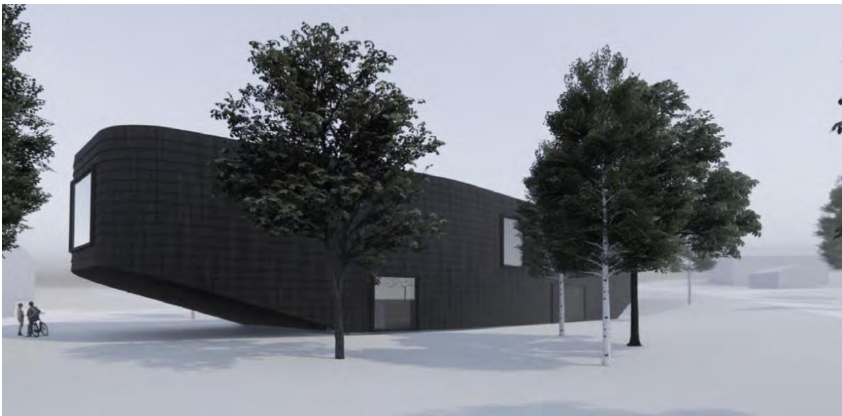
Illustrasjon av eksteriør

Utvendig kledning skal være i tre. Løsningen som er valgt er kledning av overflatebehandlet sitka-gran, organisert i overlappende 450 mm rader. De horisontale radene gir assosiasjoner til den tradisjonelle klinkebåten og en oscillerende struktur i treplatene er en direkte referanse til fiskeskjell. Overflatebehandlingen vil være flammebehandling og tjærebasert beis som i stavkirker og tradisjonelle båter.